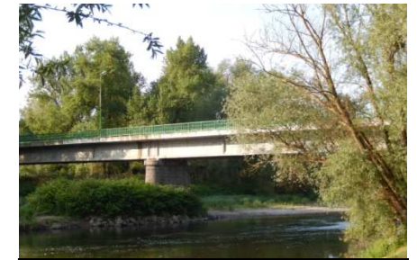
Nouveau Pont de Limons achevé en 1966