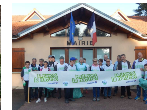
Nettoyons la Nature