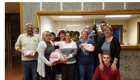
Concours de Belote Comité de jumelage