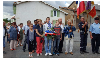
Commémoration 14 Juillet