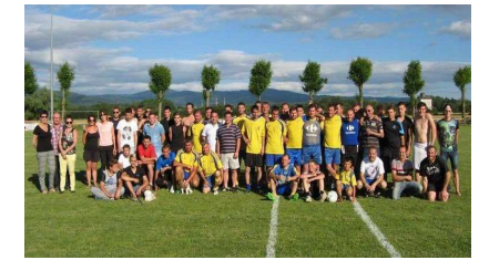
Tournoi Pierre Saint André